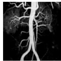
(MRA mit Kontrastmittel)

Verengungen (Stenosen) oder Verschlüsse und daraus resultierende Durchblutungsstörungen können erfasst und lokalisiert werden.