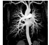
Lungenarterien und Hauptschlagader (MRA mit Kontrastmittel)

Die Gefäß-Vorsorgeuntersuchung nimmt ca. 45 Minuten in Anspruch.